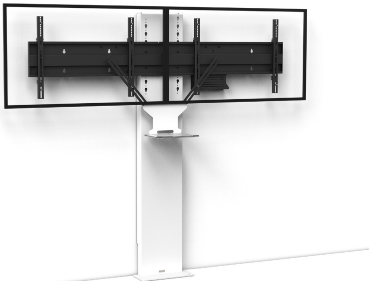
Simulation écrans 46"

Références : STILIXD4050VCPACK STILIXD5270VCPACK