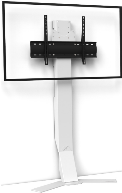
Simulation écran 55"