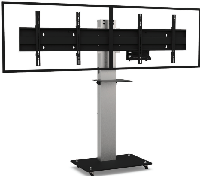
Simulation écrans 46"

Références : BOXERD4050VCPACK BOXERD5255VCPACK