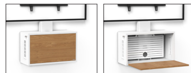
Fijación de pared