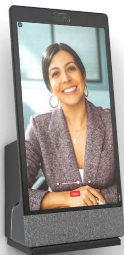
Inclinaison naturelle du Neat Frame à 8°