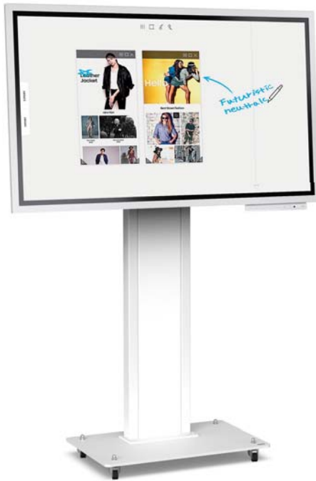
Simulation écran 55"

Cette fixation peut accueillir un écran interactif de 55 à 65 pouces qui nécessite une rotation en mode portrait et paysage.