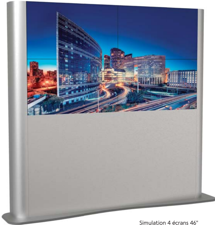
Simulation 4 écrans 46"

Le MUR D'IMAGES à poser est un meuble multi-écrans pour l'affichage ou la vidéoconférence. Selon les versions, ce meuble peut accueillir 4 à 9 écrans de 46 ou 55 pouces (bords fins).