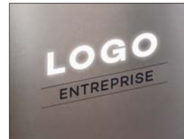
Option : logo rétroéclairé et /ou adhésif