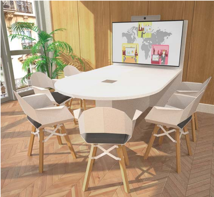
Simulation écran 55"