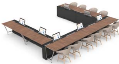
7 modules interconnectés