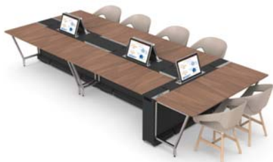
5 modules interconnectés