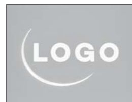
Option : logo rétroéclairé