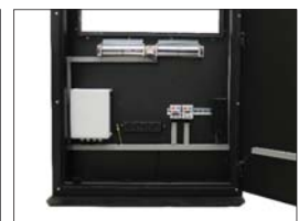
Exemple d'intégration des équipements