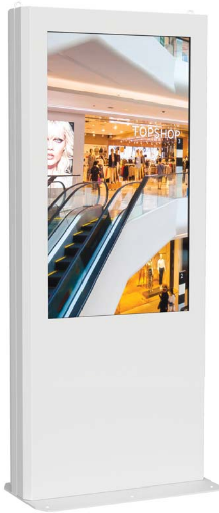
Simulation écran 55"