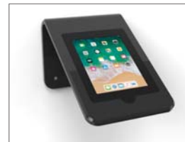
Oberflächen in Schwarz

Einbau eines 9 bis 12,9 Zoll Tablets möglich Das Modell des Tablets ist unserem Vertrieb zu nennen