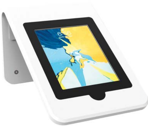
Simulation 10" Bildschirm

I-PLEX ist eine Halterung für Tablets für Empfangsbereiche oder Bereiche mit hohem Durchgangsverkehr (Messen, Galerien, Kaufhäuser, Showrooms usw.). Diese Halterung ist für Touchscreen-Tablets mit einer Größe von 9 bis 12,9 Zoll vorgesehen.