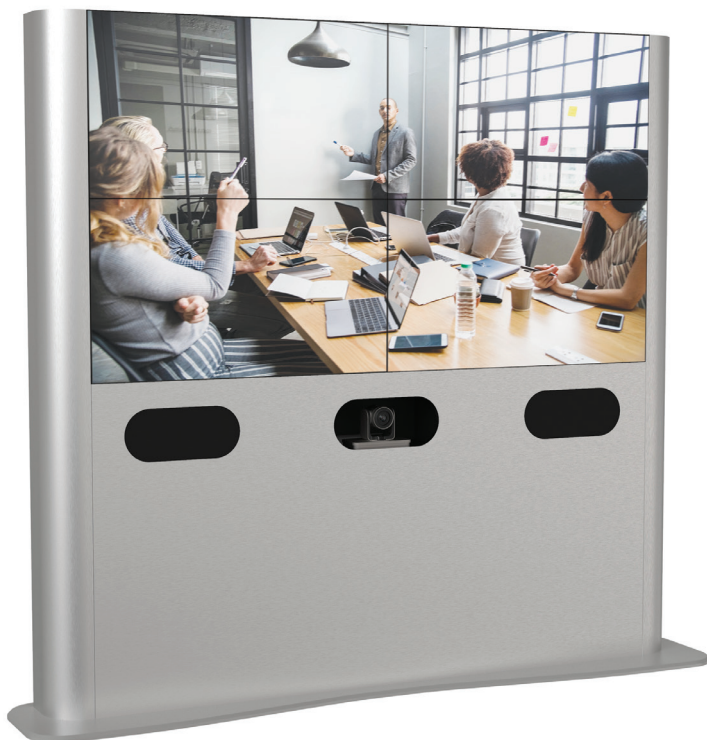
Configuration 4 écrans 46"