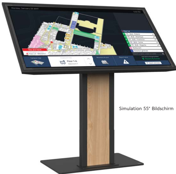
Simulation 55" Bildschirm

OBOX TOUCH ist eine Halterung für einen 32 bis 60 Zoll Touchscreen. Sie eignet sich für Empfangsbereiche oder Bereiche mit hohem Durchgangsverkehr (Messen, Galerien, Kaufhäuser, Showrooms usw.).