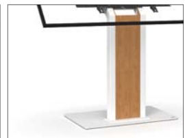
Option : Oberflächen in Weiß (/WHITE)