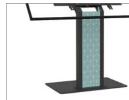
Option : andere Ausführungen der Plexiglasplatte