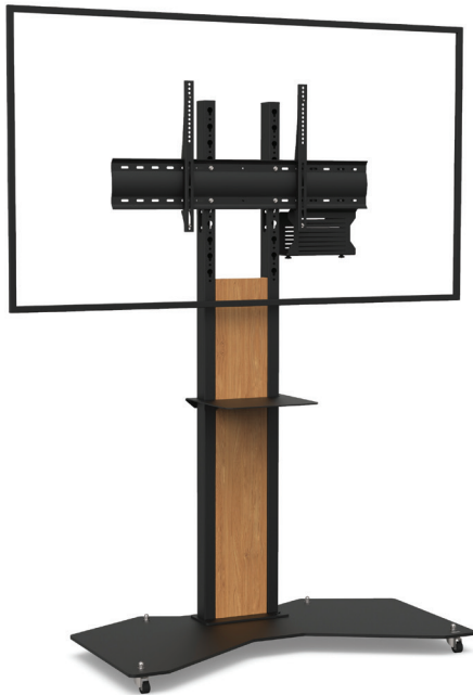
Simulation écran 70"