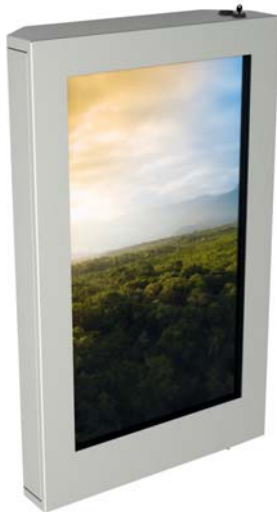
Simulation 55" Bildschirm

Das OUTDOOR-GEHÄUSE ist eine Lösung für Anzeigen im Außenbereich. Je nach Modell geeignet für die Aufnahme eines 40 bis 65" Bildschirms.