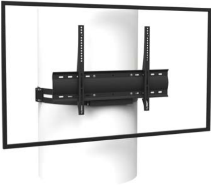
Simulation 55" Bildschirm

Die Pfostenhalterung ist ideal, um einen Bildschirm unauffällig in eine Umgebung zu integrieren.