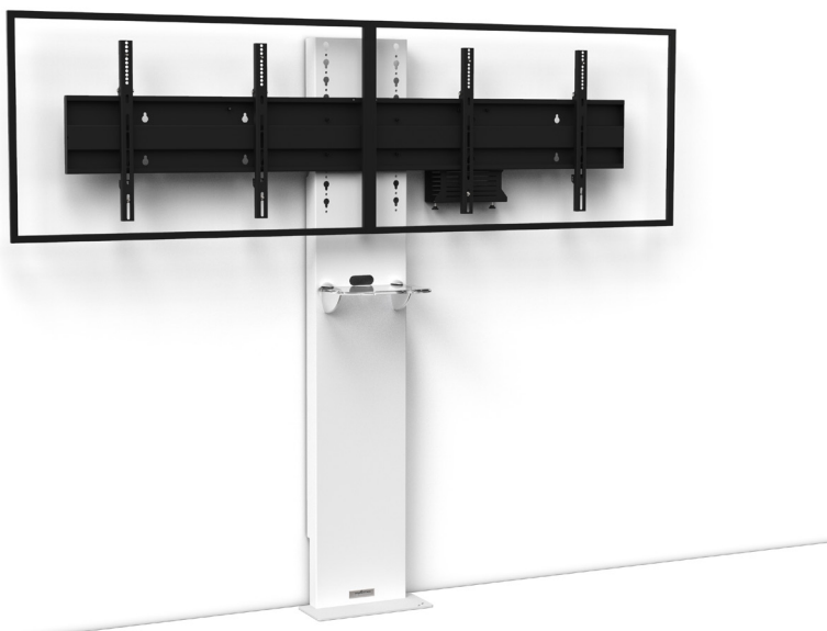
Simulation écrans 46"

Références : STILIXD4050VCPACK STILIXD5270VCPACK