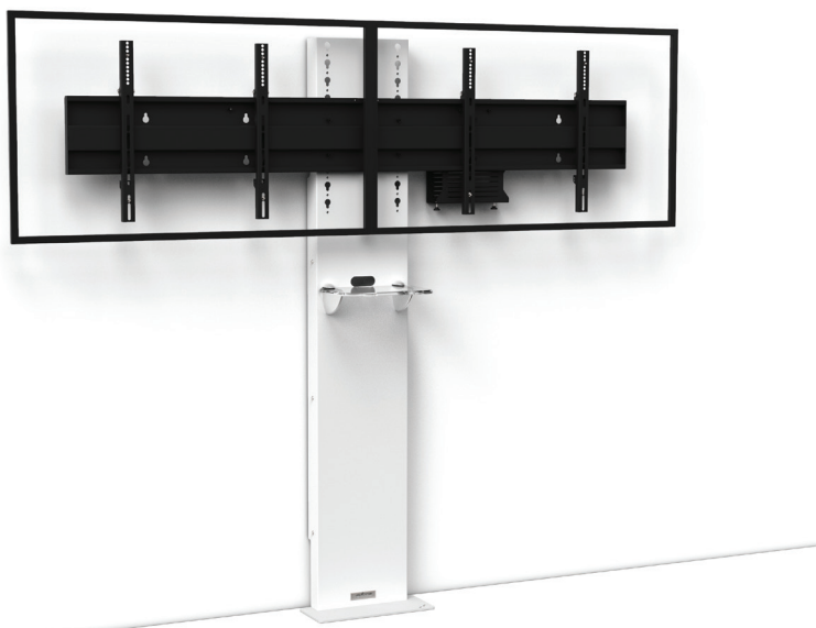
Simulation écrans 46"

Références : STILIXD4050VCPACK STILIXD5270VCPACK