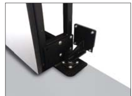
Mit Scharnieren und auf Laufrollen