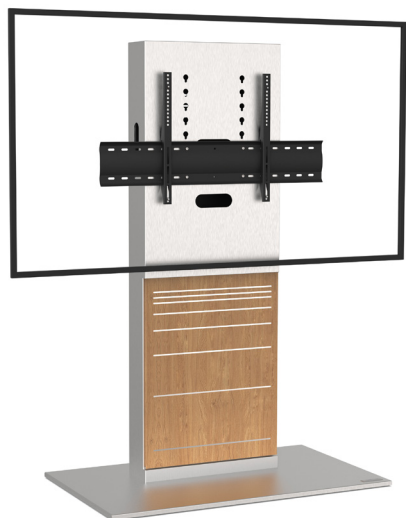
Simulation écran 70"