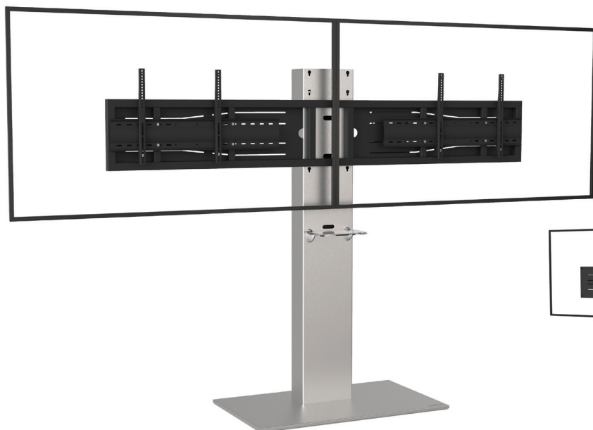
Simulation écrans 75"