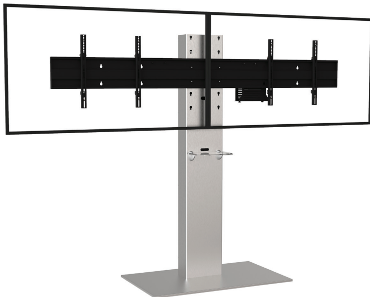
Simulation écrans 65"