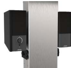
HALTERUNG FÜR SPEAKER BOSE COMPANION 2 SERIE III

Unter dem Bildschirm Befestigung an der Säule