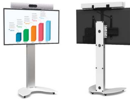
KAMERAHALTERUNG FÜR CISCO WEBEX ROOM KIT ODER KIT PLUS

Art. WEBEX BOARD 55 WEBEX BOARD 70 WEBEX BOARD 85