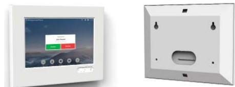
HALTERUNG FÜR CISCO TOUCH 10

Oberflächen in Weiß, zur Befestigung an der Wand