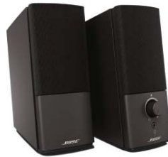
SPEAKER BOSE COMPANION 2 SERIE III

Passive Lautsprecher von Bose zum Aufstellen auf eine großformatige Ablageplatte oder zum Integrieren in seine spezielle Halterung