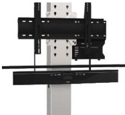
KAMERAHALTERUNG FÜR YAMAHA CS 700 UND YAS 300

Befestigung an VESA-Halterung des Bildschirms Unter dem Bildschirm