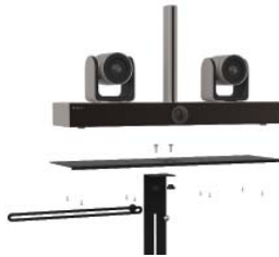
KAMERAHALTERUNG FÜR POLY EAGLE EYE DIRECTOR II

Über dem Bildschirm Befestigung an VESA-Halterung des Bildschirms