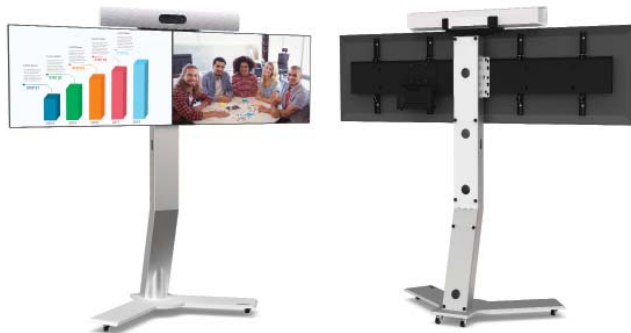
KAMERAHALTERUNG FÜR CISCO WEBEX ROOM KIT ODER KIT PLUS

Über dem Bildschirm Befestigung an VESA-Halterung des Bildschirms Art. ADT_WEBEX_SE_R2