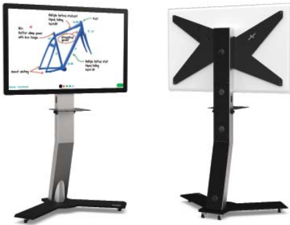
SPEZIELLE BEFESTIGUNG FÜR CISCO WEBEX BOARD 55", 70" ODER 85"

Art. WEBEX BOARD 55 WEBEX BOARD 70 WEBEX BOARD 85