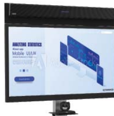
SOUNDBAR-TRÄGER TELEVIC NUREVA

Über dem Bildschirm Befestigung an VESA-Halterung des Bildschirms